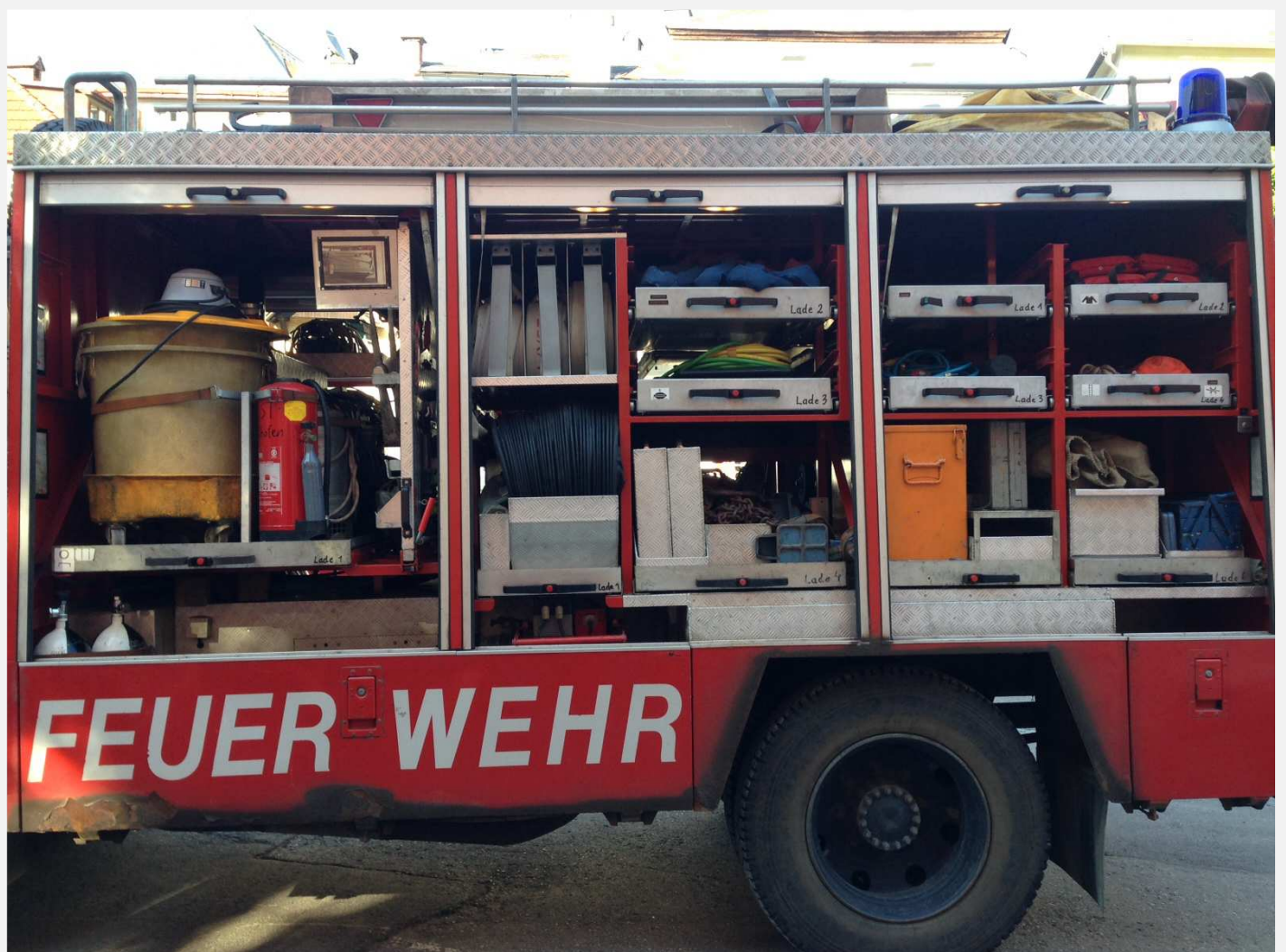
Feuerwehraufbau mit Auszügen