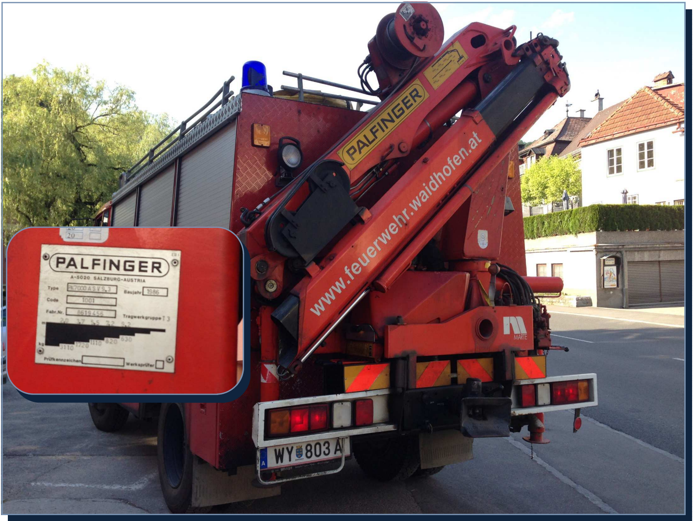
Heckkran PK 7000 ASV 9.3, Baujahr 1986 mit Winde und TÜV Abnahme