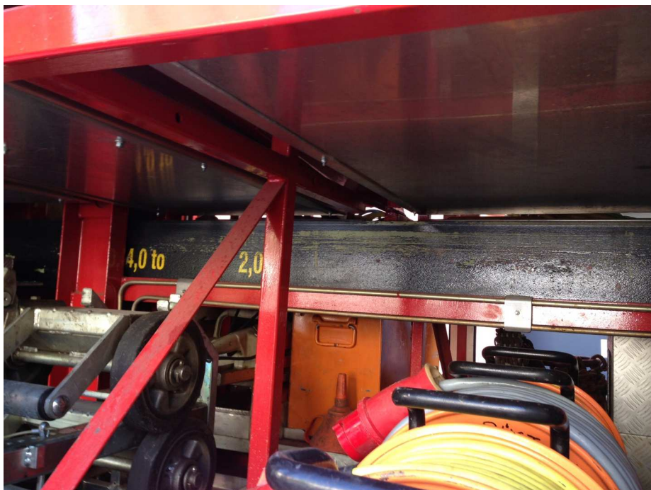
Abschleppbalken hydraulisch nach hinten ausfahrbar

Feuerwehr Waidhofen an der Ybbs Stadt, Bidergasse 1, 3340 Waidhofen an der Ybbs Ansprechpartner: Gerhard Schnittler Tel.: 0664/3504016 gerhard.schnittler@meiller.com